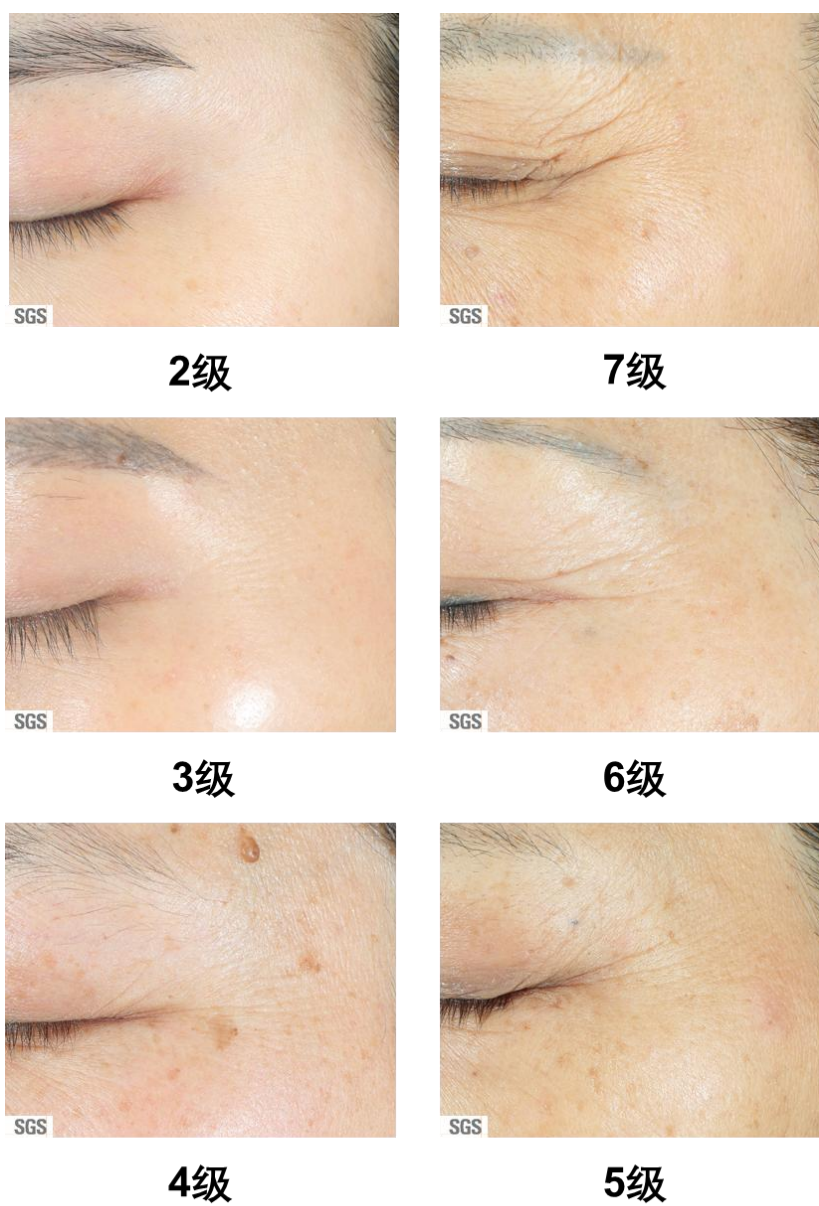
图 B.1 眼角皱纹等级图谱